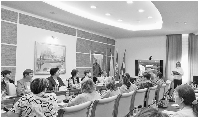
Педагоги СГО на презентации электронной версии учебника «Люблю тебя, мой Соликамск»

— Очень приятно, что наш проект получил поддержку в муниципалитете, и, видя интерес, который проявляют к учебнику