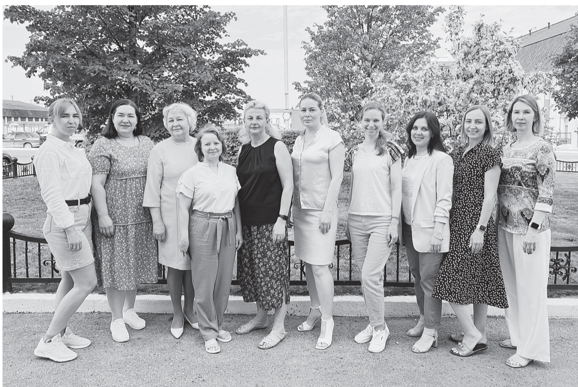
Совместная фотография — лучшее начало трудового дня

— Эту ситуацию исправили участники Всероссийского кадрового конгресса, который прошёл в мае 2005 года. Они постановили, что 24 мая — это День кадровика, так как это дата издания постановления Правительства Российской империи, в котором регулировались отношения руководителей промышленных предприятий и их наёмных рабочих. Было это в 1835 году. Поэтому мы празднуем День кадровика 24 мая, а 12 октября обычно отмечают свой праздник кадровые работники структур МВД, потому что именно в этот день в 1918 году при милиции появились первые отделы кадров.