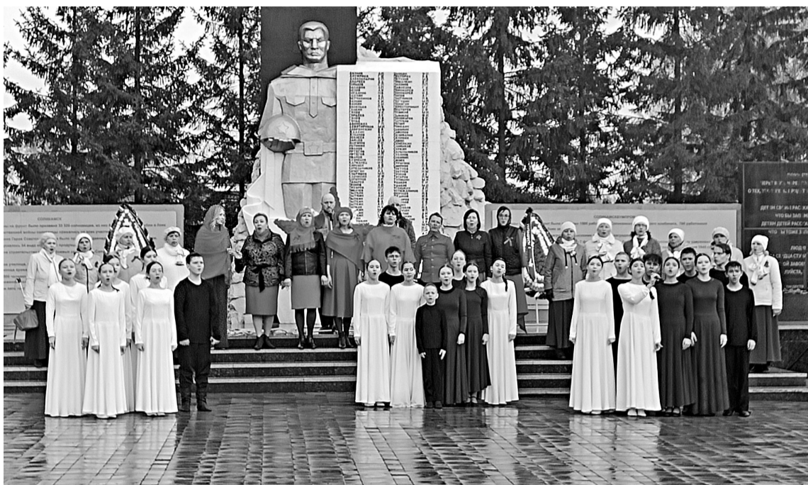
Как далёкий огонёк был День Победы

В предпраздничный день — 8 мая, по давней традиции, на центральной проходной рабочая молодёжь и специалисты по связям с общественностью встречали бумажников. Здесь проходила акция «Георгиевская лента». В этом году было вручено порядка 2000 ленточек.