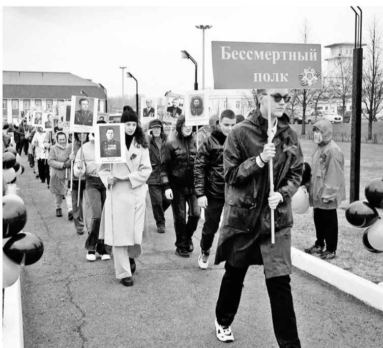
Идёт «Бессмертный полк»

— Мы все заряжены позитивными эмоциями! — делится