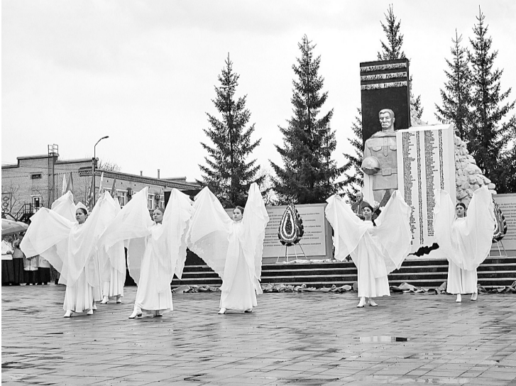
«Перемена» исполняет танец под песню «Журавли». 8 мая 2024 года