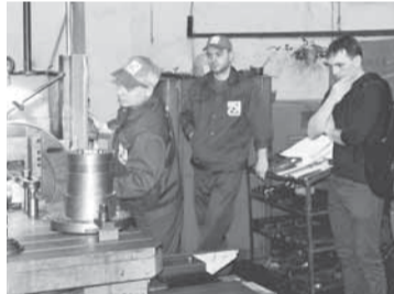
Вам от нас мастер-класс!

— В настоящее время профессии токарь в основном обучаются на производстве. Для нас особенно важно вырастить своих мастеров токарного дела. Сегодня мы ждем на предприятии молодых ребят, желающих освоить эту интересную, интеллектуальную профессию непосредственно на рабочем месте в ремонтно-механическом цехе. Конкурсы профессионального мастерства помогают заинтересовать молодых работников в этой специальности, мотивировать их на совершенствование