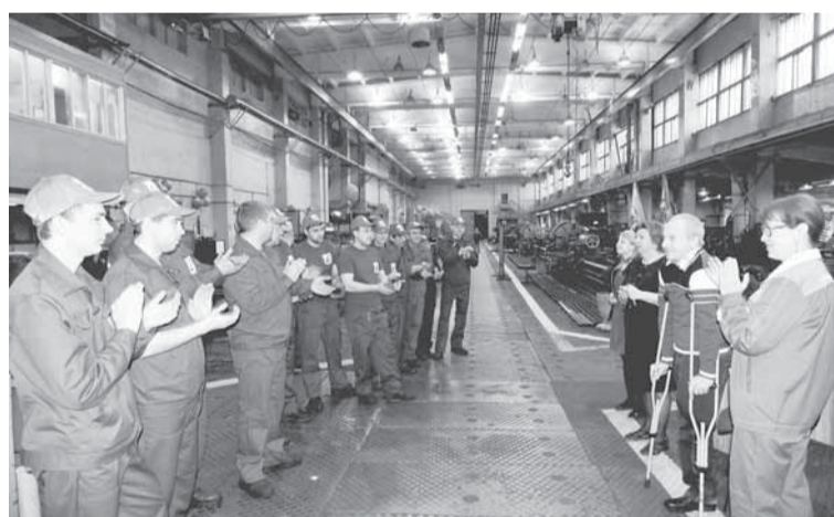
Приветствие конкурсантов перед практическим этапом.

Накал соревнования, запах металлической стружки и горящие глаза устремленных к победе токарей. В ремонтно-механическом цехе 11 декабря состоялось действительно грандиозное событие — конкурс профессионального мастерства на звание «Лучший токарь-2015».