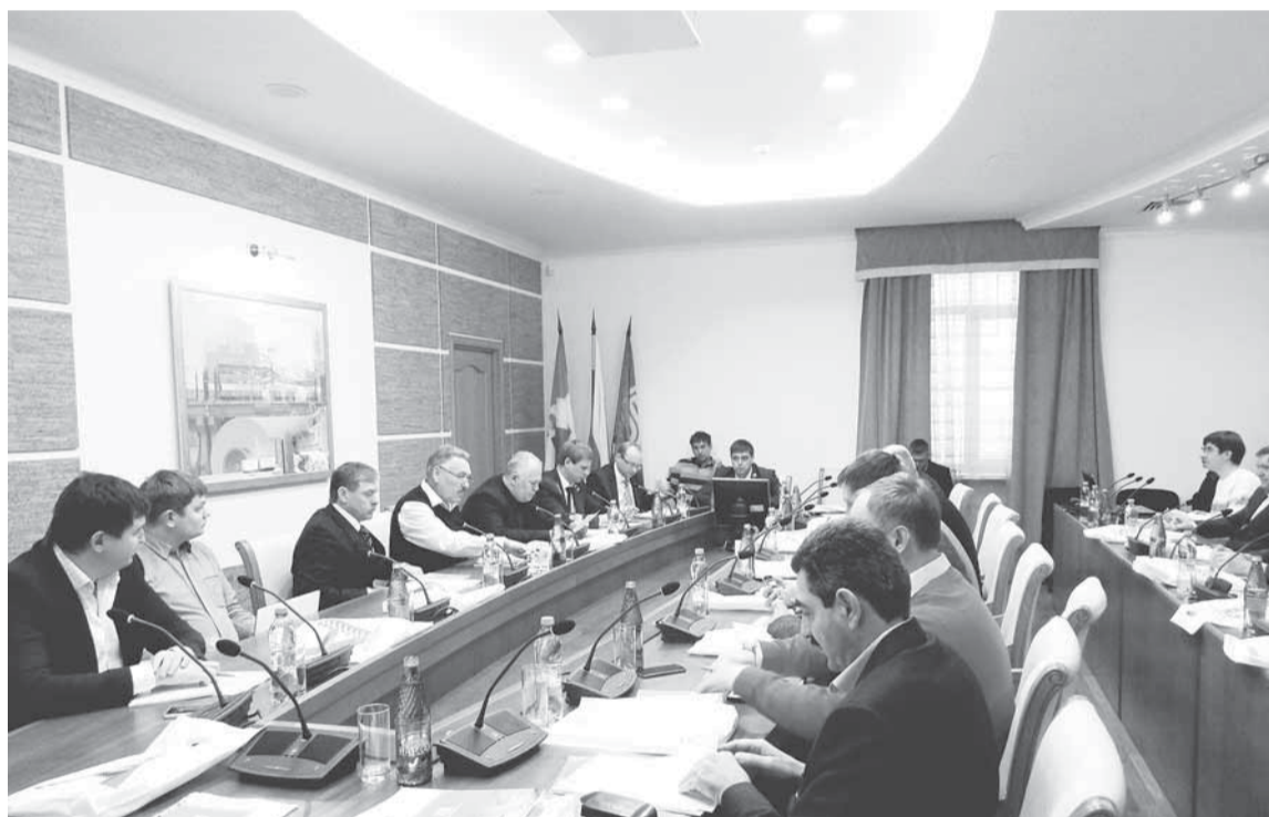
На заседание членов Некоммерческого партнёрства «Лесопромышленники Прикамья» в Соликамске собралось 30 участников.

11 ДЕКАБРЯ 2015 ГОДА ВО ДВОРЦЕ КУЛЬТУРЫ «БУМАЖНИК» ОАО «СОЛИКАМСКБУМПРОМ» СОСТОЯЛОСЬ ВЫЕЗДНОЕ ЗАСЕДАНИЕ НЕКОММЕРЧЕСКОГО ПАРТНЁРСТВА «ЛЕСОПРОМЫШЛЕННИКИ ПРИКАМЬЯ».