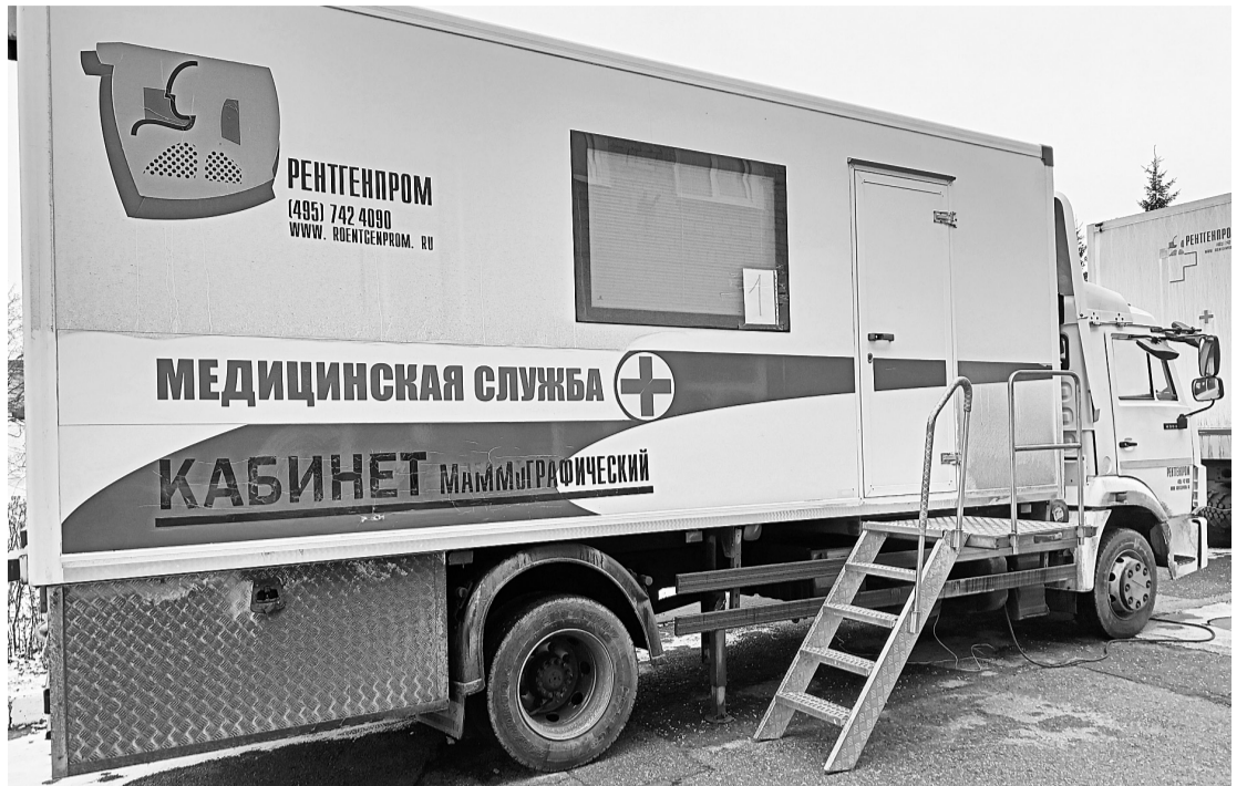
В рамках профосмотров АО «Соликамскбумпром» организовало маммографическое обследование мобильными бригадами краевого онкоцентра

— В АО «Соликамскбумпром» утверждена и функционирует Политика в области охраны труда и промышленной безопасности. С нею ознакомлены все работники. Крайне важно, чтобы именно работники в первую очередь соблюдали требования охраны труда. Мы системно ведём контроль над состоянием охраны труда и выполнением всех норм по промышленной безопасности,