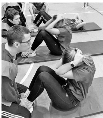
Ещё немного, ещё чуть-чуть!