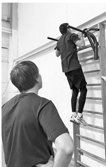
Дружеская поддержка обязательна