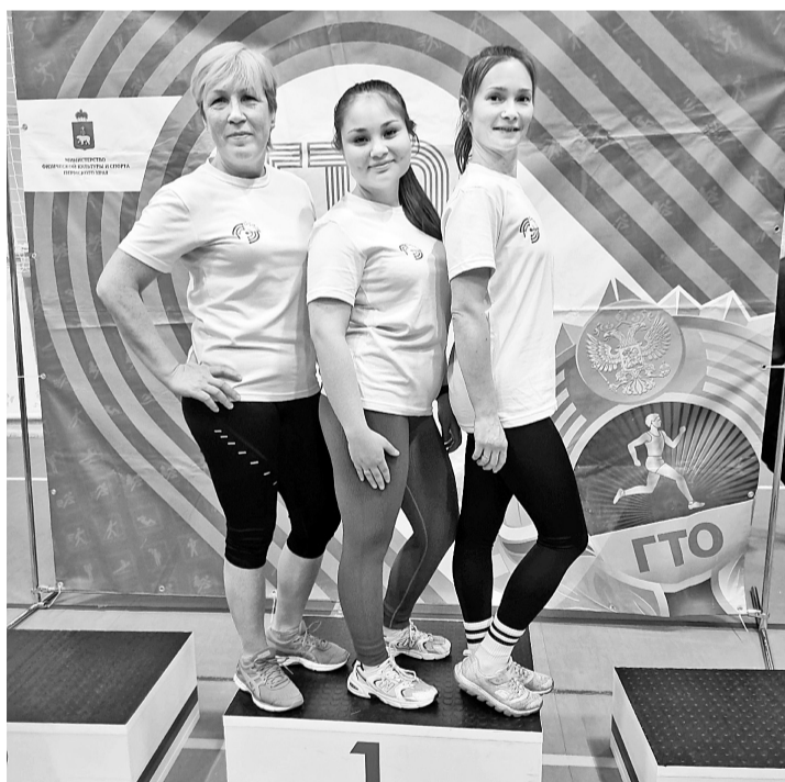
Команда Соликамской ТЭЦ

По результатам командного зачёта фестиваля ВФСК ГТО среди трудовых коллективов наши ребята заняли третьи места в своих группах.