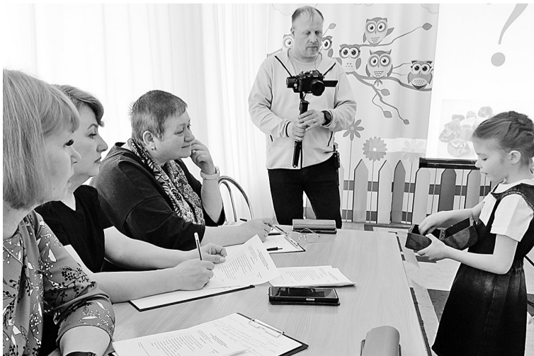
Работает строгое жюри