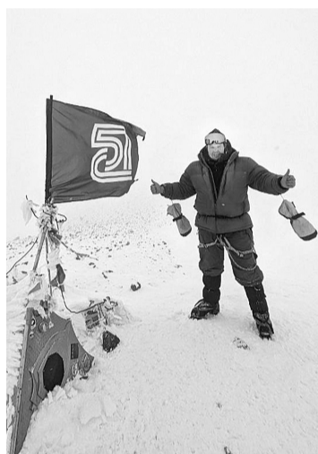
Наивысшая точка России

дели, дойдя до вершины. Горы во всём великолепии. Это огромная радость, удовольствие, наслаждение для всех, несмотря на огромную усталость. На вершине я поставил флаг Соликамскбумпром. Хочу, чтобы видели, что здесь были соликамские бумажники.