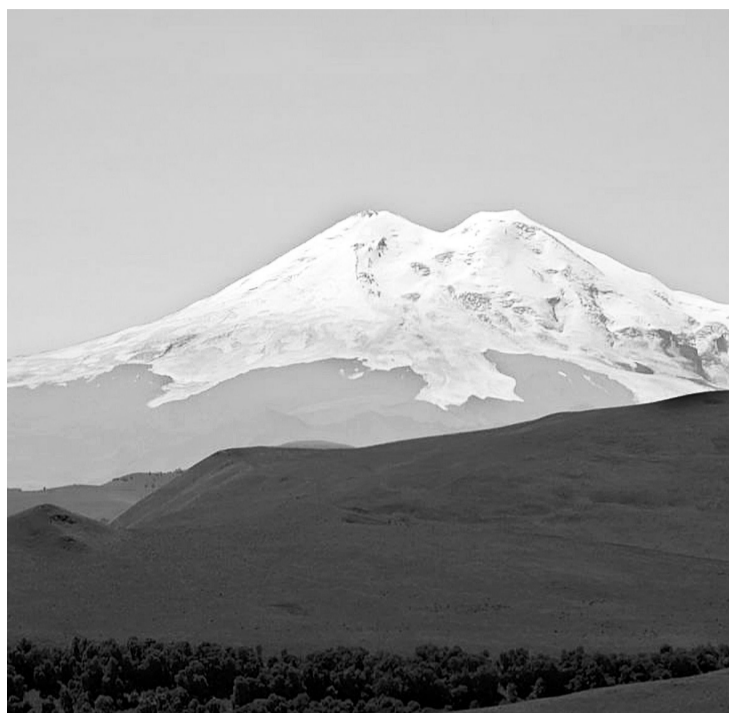
Снежная вершина Эльбруса

Было очень тяжело, особенно последние несколько метров. На высоте попали в грозу: туман, молнии. Но это всё ничто, по сравнению с тем, что мы уви-