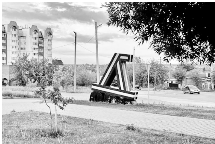
Добро побеждает Зло