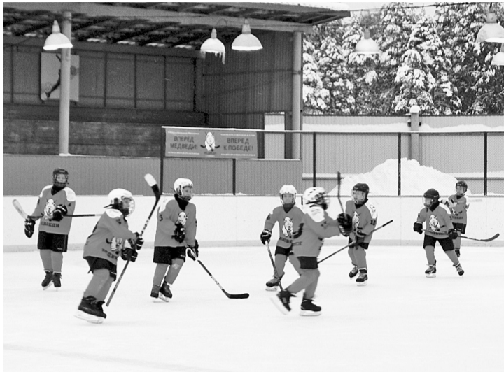
«Медведи» на корте